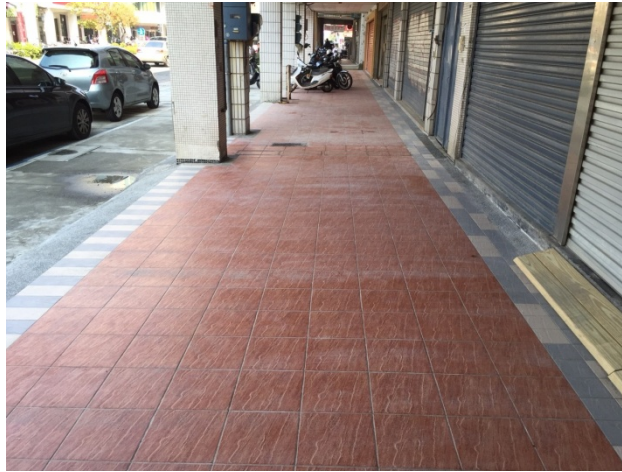
圖五、騎樓高低差以斜坡方式改善