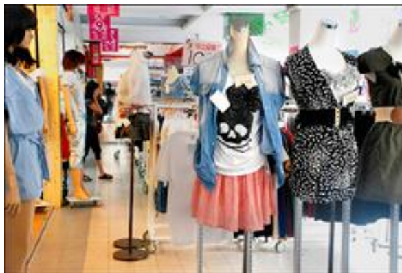
圖一、騎樓違規占用

建築物設置騎樓主要為供民眾通行，依「市區道路條例」第9條規定騎樓為道路一部分，目前騎樓面臨的主要問題為：違規占用、鋪面老舊破損、私自墊高、相鄰騎樓高程不一致等情形，造成通行不易導致民眾行走於騎樓意願降低，如圖一及圖二。