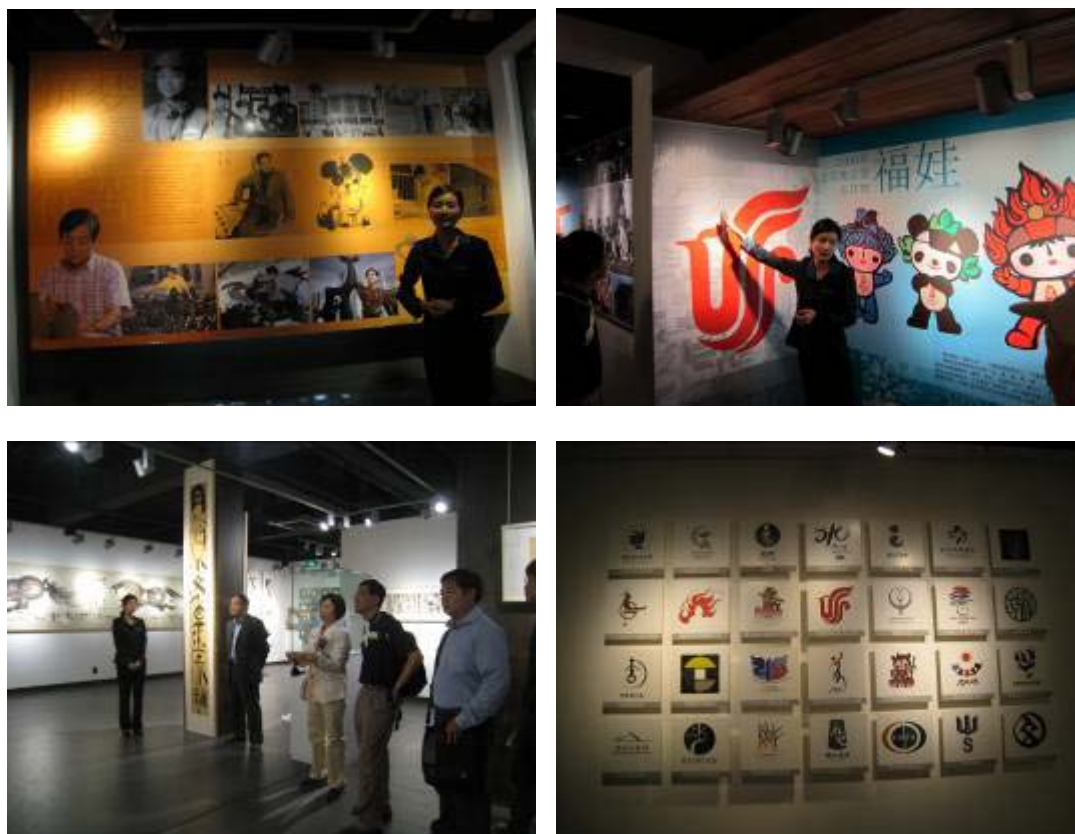
圖 26：韓美林藝術館人員導覽

要以動物為主，既是繼承了東方文化傳統藝術，又吸取西方文化精隨，把寫實、誇張、抽象、寫意、工筆及印象等諸多手法巧妙的融為一體，在陶藝品方面，則以茶壺為主要創作，最後在藝術館大廳裡與解說人員留下合影，畫下本次參訪杭州植物園的句點。