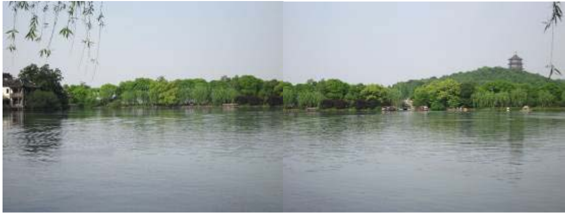
圖 44：花港觀魚公園遠觀蘇堤