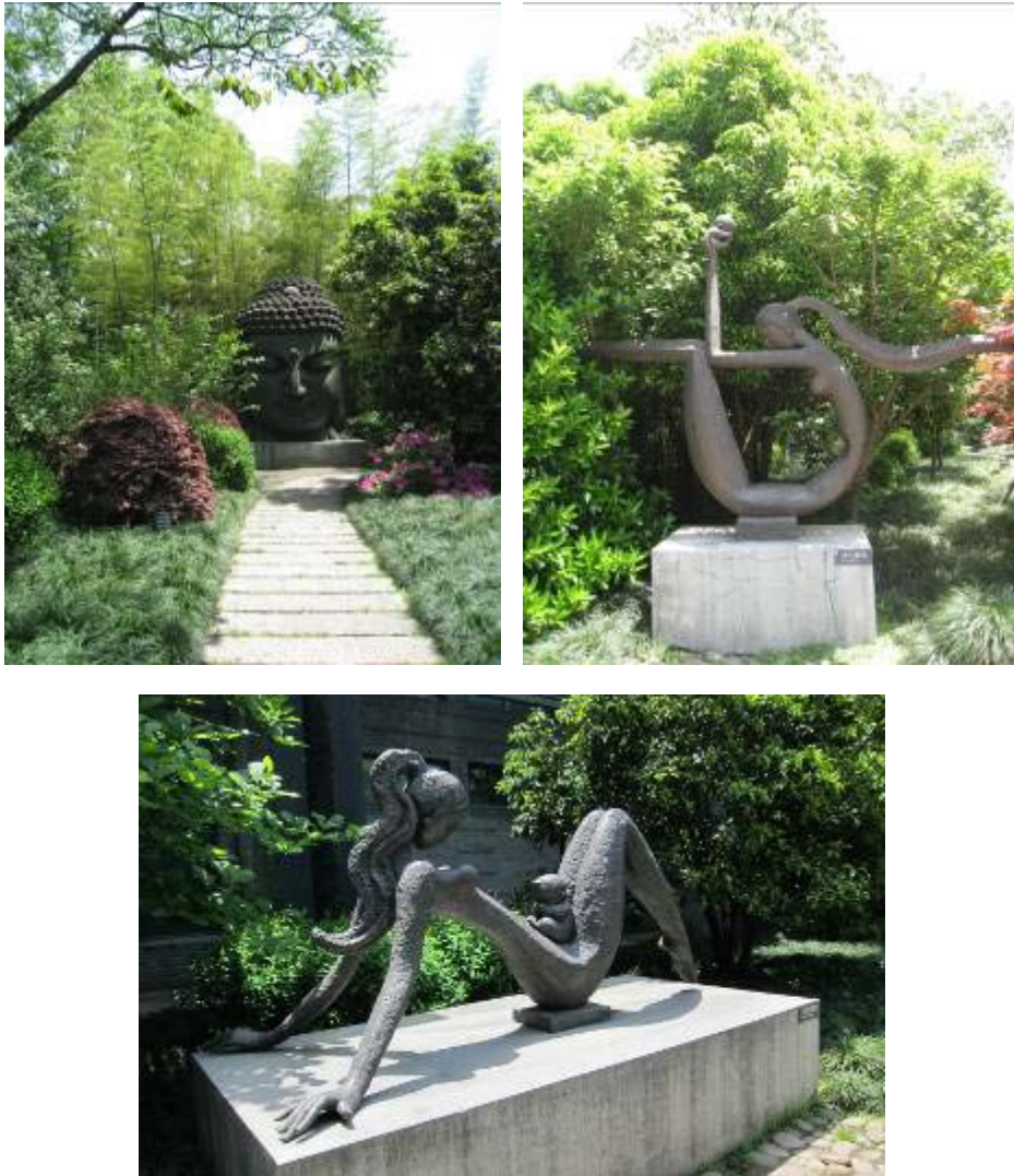
圖 24：韓美林藝術館戶外雕塑品

韓美林藝術館位於杭州植物園北側，於 2005 年正式對外開放，藝術館本體以灰牆青瓦為主，掩映在一片翠竹中，環境清新高雅，佔地約 0.4 公頃，建築佔地約 2000 平方公尺，主館為一棟三層樓建築，館內主要分為作品展示區、序廳及工作室，作品展示區設有雕塑、書法、繪畫及工藝品四大展廳，序廳主要介紹韓美林先生的生平及創作手稿，工作室則包括休息室及作坊。