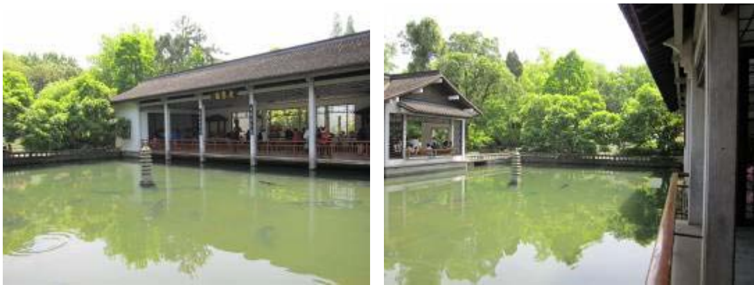
圖 12：玉泉魚躍之魚樂園