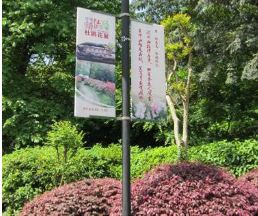
圖 7：杭州植物園杜鵑花展廣告

物園杜鵑花展，以及最具特色及歡迎之「玉泉魚躍」及「靈峰探梅」兩處景點，經由該人員接洽韓美林藝術館，委請館內專業解說人員協助導覽。