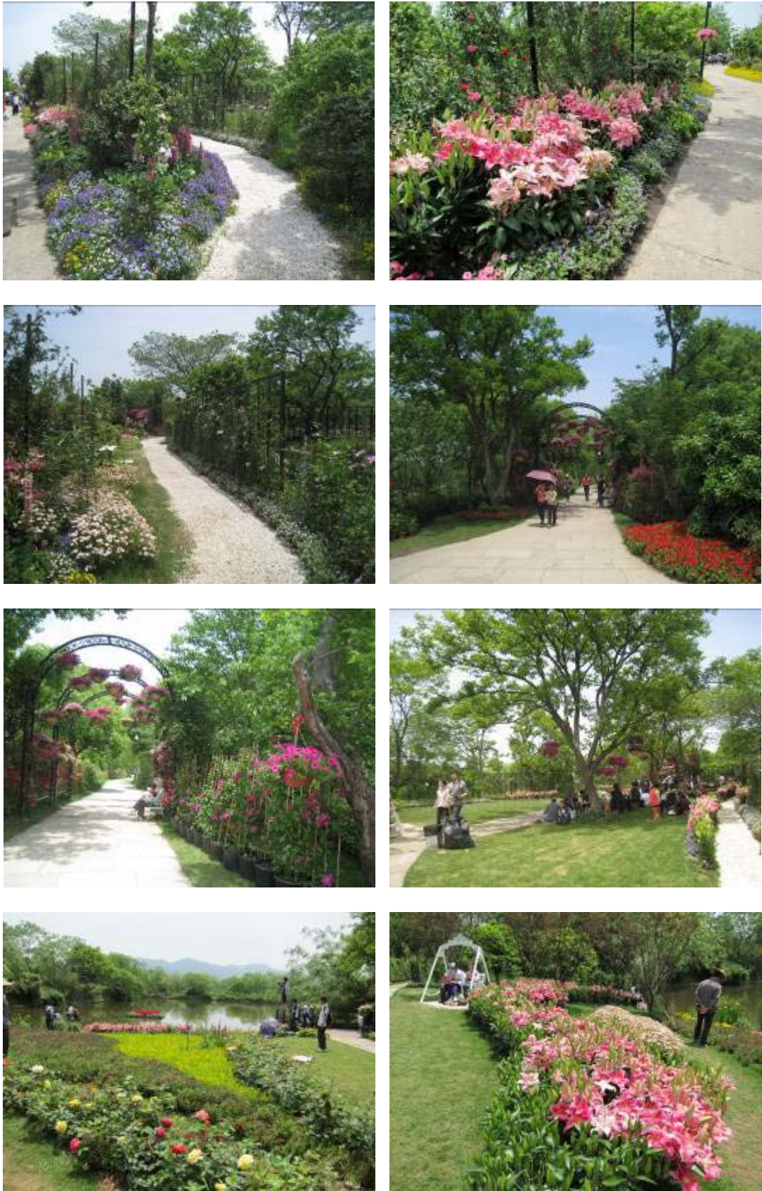
圖 40：西溪花朝節沿線景點