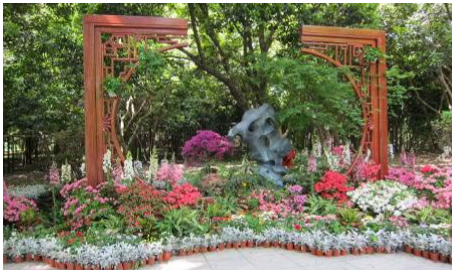
圖 2：植物園區入口花藝

杭州植物園區環境優美，景色隨四季變化，並以春觀杜鵑、夏荷盎然、秋桂飄香、冬梅吐芳作為植物園變化主軸。