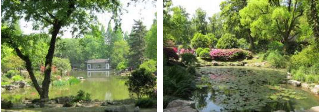
圖 3：山水園及玉泉荷花池

微風拂過飄來縷縷清香，睡蓮也不畏烈日，嬌艷的盛開著，吸引水鳥駐足觀賞，另玉泉魚池，池水清澈見底，眺望青魚翔淺於池裡，心境也隨之變得貯靜及豁然，夏季的植物園，沒有都市的喧囂及躁熱，在碧波盎然與魚池閒靜的感染，列日的驕陽也變得溫柔。