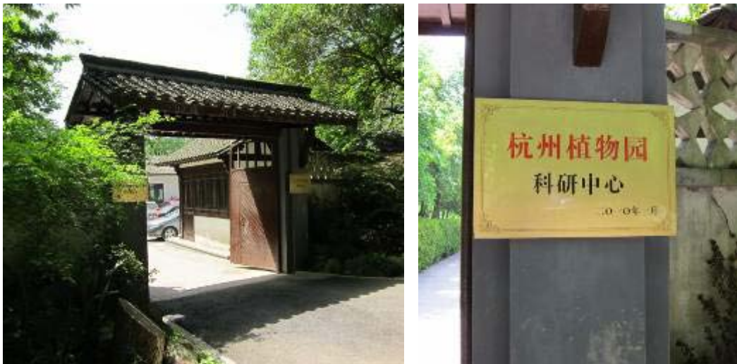
圖 6：杭州植物園區科技研究中心

本次參訪杭州植物園區，順道拜訪杭州植物園區科技研究中心，經由該中心研究人員帶領，特別參訪園區內正舉辦浪漫杜鵑、情定玉泉之 2012 年杭州植