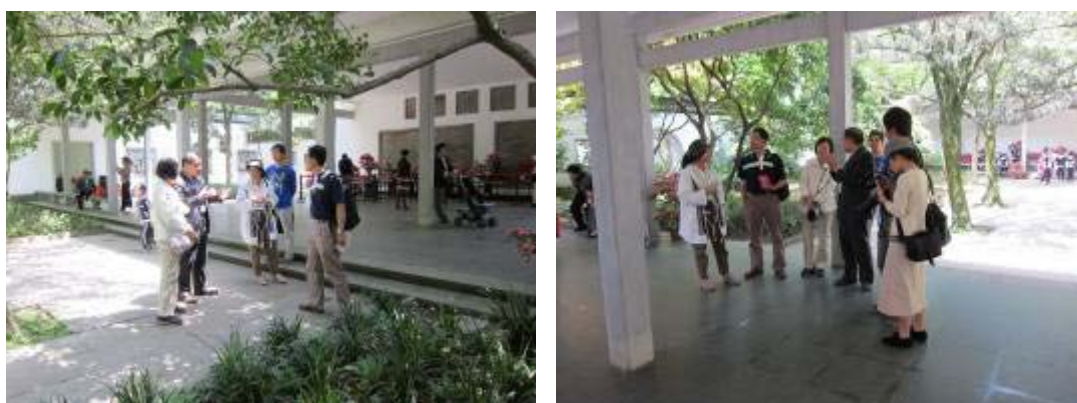
圖 15：植物園區研究人員景點解說

座具有江南特色庭園景觀，整組建築採用粉牆漏窗，藉由迴廊環接相互掩映，形成景中有框，框中有景，呈現出景中有景及園中有園之巧妙特色，另玉泉與虎跑泉及龍井泉共列西湖三大名泉，其中以玉泉為最古老，經由多次改建及擴建，以及長期細心維護，已成為揚名四海賞泉景點。