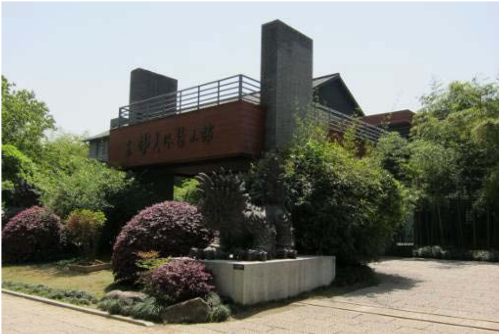
圖 5：韓美林藝術館外觀