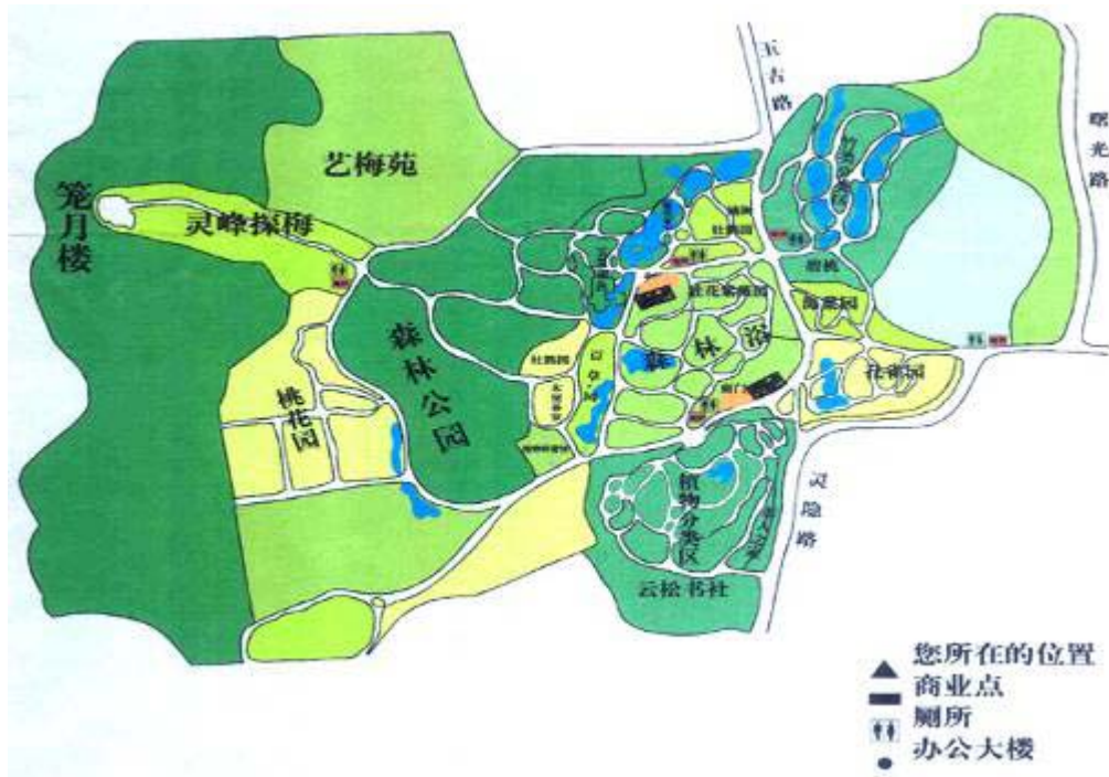
圖 1：植物園區平面圖

杭州植物園隸屬於杭州市風景名勝區管委會，座落於西湖風景區西北側，北依群山，東接岳王廟，西臨靈隱寺，建於西元 1956 年，總面積約 248 公頃，是座集物種保存、科學研究、科學教育及休憩娛樂為一體的綜合性多功能植物園區，擁有植物約 3500 餘種，素有植物博物館美譽，園內有百草園、植物分類區、玉泉魚躍、靈峰探梅、山水園、竹類區、木蘭山茶園、桂花紫薇園、杜鵑園、櫻花碧桃園、槭樹杜鵑園、森林公園、韓美林藝術館等 9 個展覽區和 4 個實驗區，環境優雅各具特色，其中「玉泉魚躍」、「靈峰探梅」兩點景點最受歡迎。