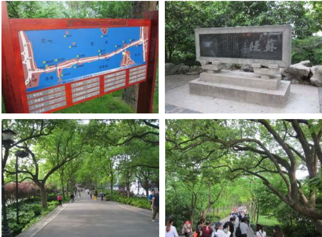
圖 46：蘇堤堤岸標牌及綠意盎然景色

花港觀魚公園位於西湖蘇堤南端西側，前接柳絲垂蔭的蘇堤，北靠層巒疊翠的西山，早在南宋時期，有一小溪名為花港由花家山流入西湖，當時內侍官盧允升在溪旁建造一處私人庭園，於園內鑿石養魚，色彩繽紛，數量可觀，吸引文人雅士前來觀賞，而花港觀魚之名就漸漸傳開，成為南宋時期西湖十景之一，清代康熙皇帝下江南時親臨此地，於池邊御筆題字「花港觀魚」，據傳康熙悲憫魚當在水中游不該火上烤，落筆時改為三點水，象徵如魚得水，早初花港觀魚僅有一池及一碑，約 0.2 公頃大，經後世擴建後，仍屬西湖十景之一的大型公園，佔地已達約 20 多公頃，採取