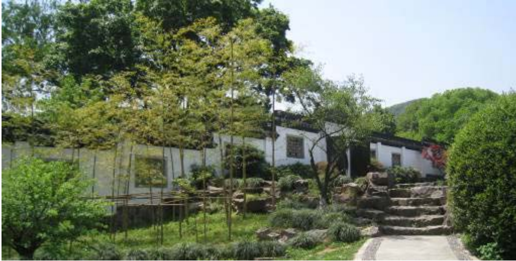
圖 20：靈峰梅園之品梅苑