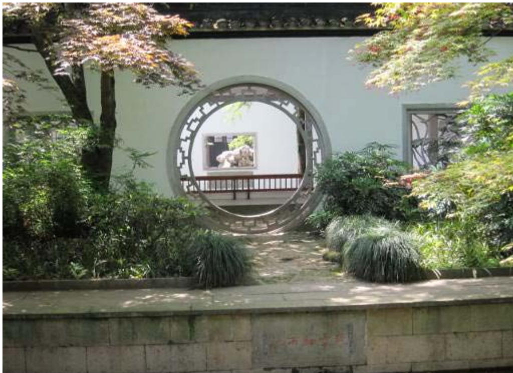
圖 14：玉泉魚躍之晴空細雨泉

本次參訪經由植物園區科研中心人員解說，了解玉泉周邊建築景點，主要藉由舊寺廟基礎改建成為一