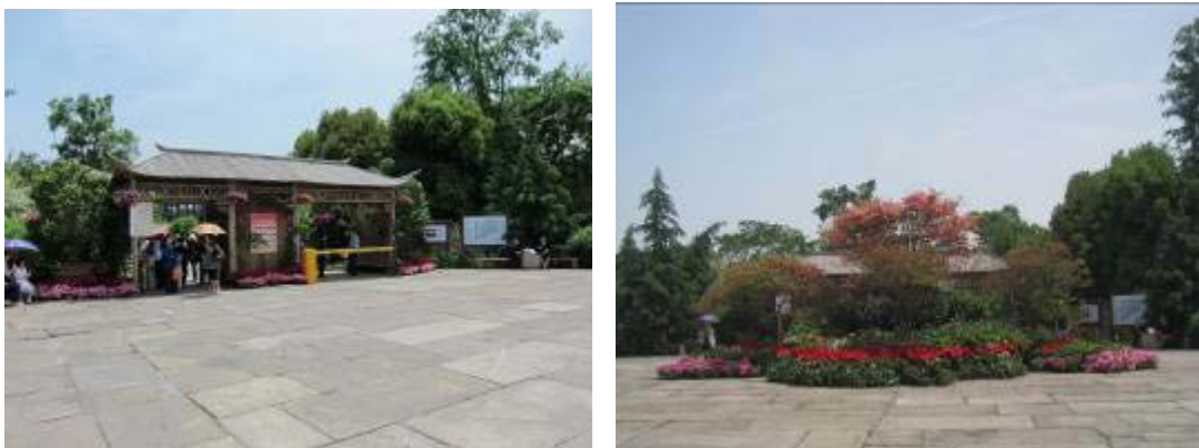
圖 39：西溪花朝節入口處

本次參訪西溪濕地公園，另一項主題也就是一年一度的西溪花朝節，花朝節原自唐朝武則天時代，係為一個慶賀百花生日的節慶，在歷史上花朝與月夕並提，花朝係指春天的一半，為農曆的二月十五日，月夕則為秋天的一半，為農曆的八月十五日，也就所謂的中秋節，自南宋以來就有四時賞花的習俗，隨著近代的變遷花朝節的慶典也漸漸落寞，僅有中秋節賞月的慶典仍持續著，因西溪濕地公園的自然生態景觀優美，地質條件適合花卉生長，其腹地足以辦理大型花展，並與花朝節文化有著深厚的歷史淵原，西溪濕地公園則成為每年花朝節主辦場地，本次花朝節的舉辦於4月17日至5月20日為期34天，活動主軸全部圍繞著花的展示，包括主題花卉展覽及花車巡遊等活動，主要觀賞區開闢了12片特色花卉區，展現花映綠堤的絢彩景色，以提供西溪濕地遊客徜徉在花海中，欣賞百花盛開的春日美景。