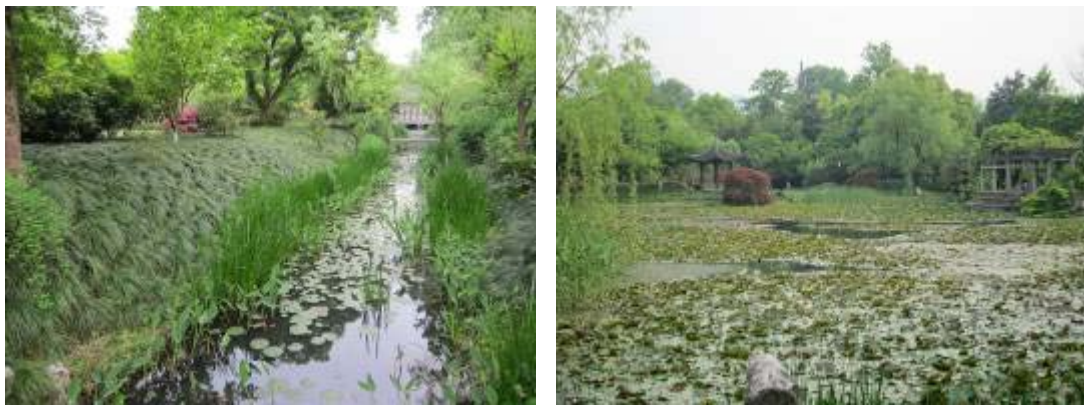
圖 50：杭州花圃園內景觀

杭州花圃現今已成為集景觀、休閒及遊憩等功能的一處綜合性公園，園內共有植物 300 餘種，豐富的植物種類為營造特色景觀提供多樣元素，藉由得天獨厚的地勢變化及自然資源條件，利用植物在不同季節所呈現型態及色彩，節合地形起伏的特點，使景區內花卉植物增加空間的層次感，形成繽紛多樣的植物生態景觀，並豐富了遊客賞花的視覺享受。