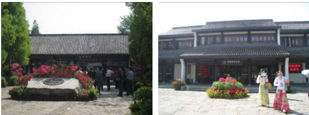
圖 30：西溪國家濕地公園入口及購票處

西溪國家濕地公園簡稱西溪濕地，為中國古運河起點及乾隆下江南之處，在歷史上經歷始啟漢晉、唐宋發展、明清全盛及民國衰落等四個演變階段，位於杭州市西部，距離杭州西湖約 5 公里，與西湖及西冷並稱為杭州三西，濕地總面積約 1150 公頃，已開放遊客參觀面積約 350 公頃，包括生態保護區 170 公頃，生態恢復區 150 公頃，歷史遺存保護 7.4 公頃，服務設施區 13.6 公頃，其中約有 70% 的水域面積，6 條河流縱橫交匯，其間分佈著分支的小河、魚鱗狀的池塘，形成了西溪獨特的濕地景致，具有河港、池塘、湖泊與沼澤等不同地型，擁有豐富的自然生態資源，是一塊城中次生濕地，集文化濕地、城市濕地與農耕濕地為一體的罕見濕地，有杭州之肺的美稱，本次參訪除了觀賞濕地公園沿線景點，更趕上一年一度西溪花草節活動。