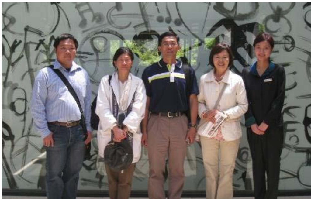
圖 29：韓美林藝術館人員合影