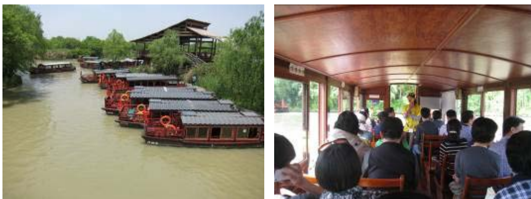
圖 33：西溪國家濕地公園電瓶船

近年來杭州市政府為發展觀光效益，於 2003 年啟動西溪濕地綜合保護工程，2005 年正式開園對外開放，2009 年獲得國際濕地公約組織認可列入國際重要濕地名錄中，成為具有生態保護、教育意義及觀光旅遊等功能的國家濕地公園，園區步道約 8 公里，步行一圈需 3.5 個小時以上，或是乘坐電瓶船，古樸設計的電瓶船低噪音無污染，平穩舒適的行駛於河道上，讓人可盡情欣賞濕地之美，沿線主要景點為煙水漁莊、深潭口、西溪梅墅、西溪草堂、泊庵等。