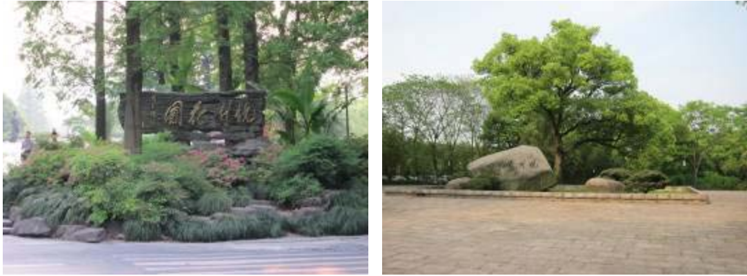
圖 49：杭州花圃前後入口

杭州花圃現今已成為集景觀、休閒及遊憩等功能的一處綜合性公園，園內共有植物 300 餘種，豐富的植物種類為營造特色景觀提供多樣元素，藉由得天獨厚的地勢變化及自然資源條件，利用植物在不同季節所呈現型態及色彩，節合地形起伏的特點，使景區內花卉植物增加空間的層次感，形成繽紛多樣的植物生態景觀，並豐富了遊客賞花的視覺享受。