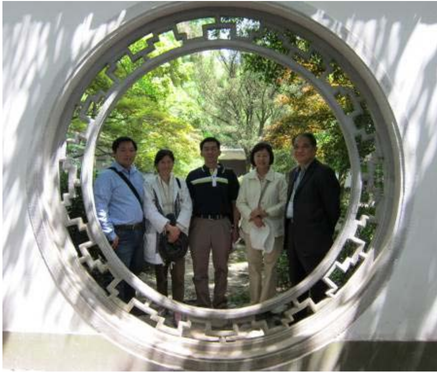
圖 17：玉泉魚躍圓洞門合照