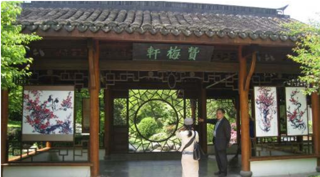
圖 21：靈峰梅園之贊梅軒