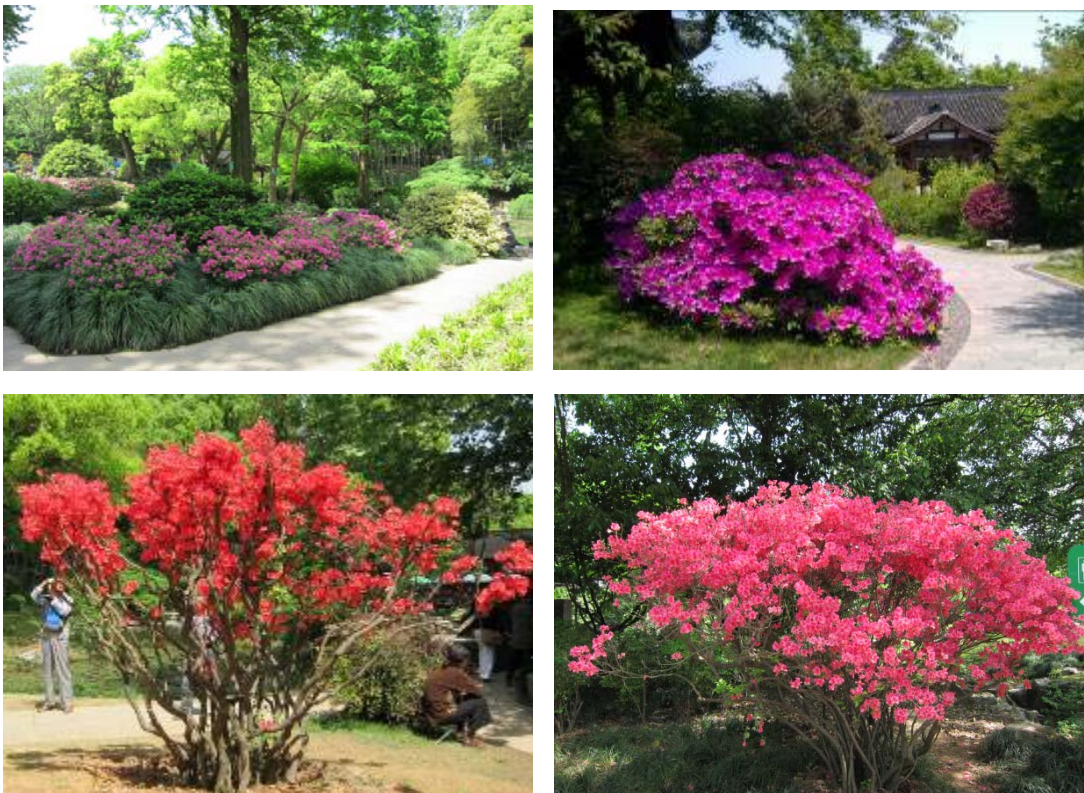
圖 9：杜鵑花盛開景色

本次展覽位於槭樹杜鵑園、山水園、玉泉、杜鵑園、經濟植物區以及科普展廳，整個觀賞區面積達 4.5 公頃，栽植杜鵑達 2 萬餘株，整個展覽分為自然觀賞區、室外景點區、盆景盆栽區、科普展示區等展區，其中以槭樹杜鵑園及杜鵑園為主要自然觀賞區，具有春鵑、夏鵑、東洋鵑等 70 餘種品種，在花開時節裡，搭配翠綠高聳的杜英林及槭樹林，風景如畫，另盆景盆栽區則以玉泉魚躍內庭園建築為主要展示區，藉由庭園建築之長廊及川堂，作為展示杜鵑盆景，與庭園建築相互映，使其建築更顯熱鬧氣氛。