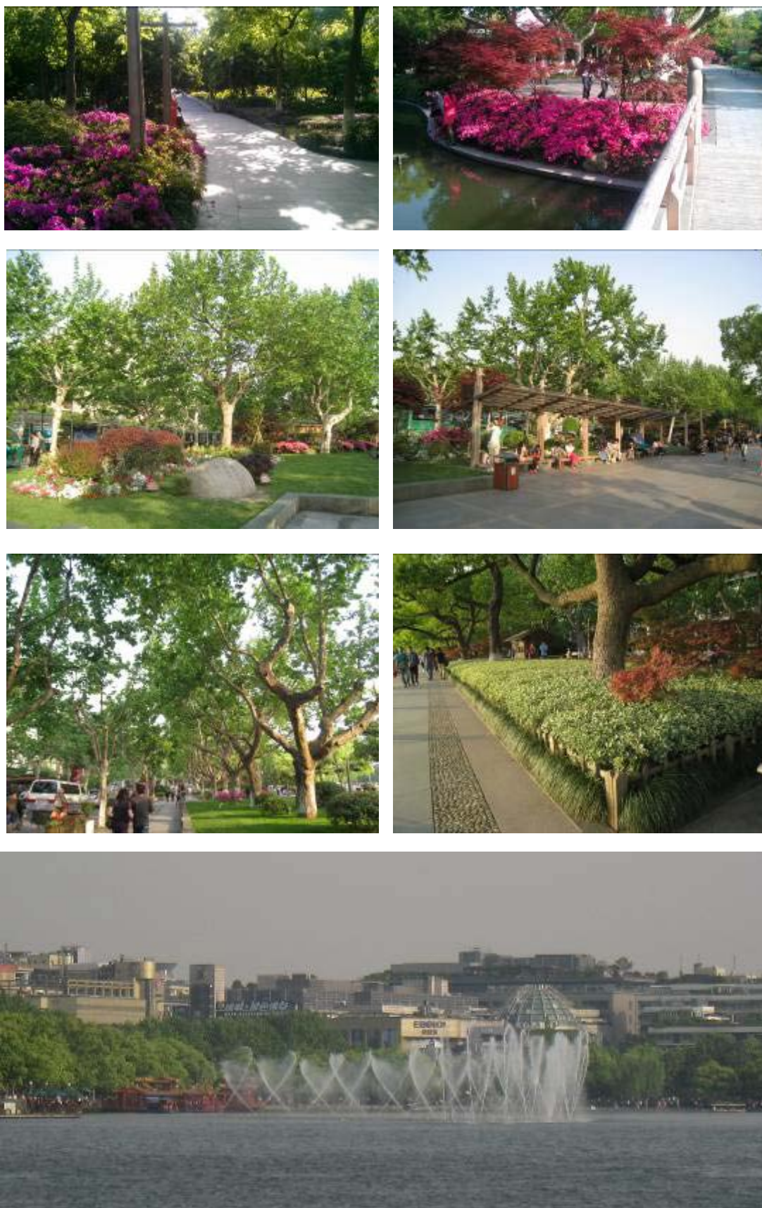
圖 45：湖濱公園及音樂水舞表演