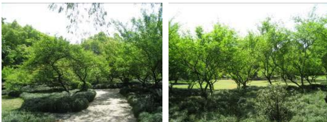
圖 18：靈峰梅園之梅樹

本次參訪雖然不是梅花盛開時期，但經由植物園區科研中心人員帶領之下，參訪了靈峰梅園裡最為精華景點『品梅苑』，並了解江南園林造景中的園中園，園內重點景區或精華區域，以圓形門作為引導，猶如柳暗花明又一村，並走訪品梅苑裡一處迴廊建築贊梅軒，藉由迴廊的展圖說明梅花品種分為三個種系五大類及 18 型。