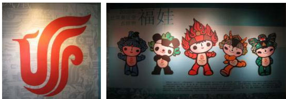
圖 27：企業標誌及北京奧運福娃