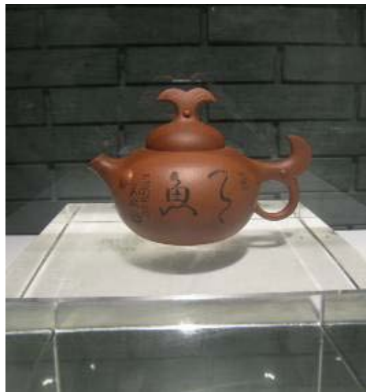
圖 28：韓美林先生繪畫及陶藝作品