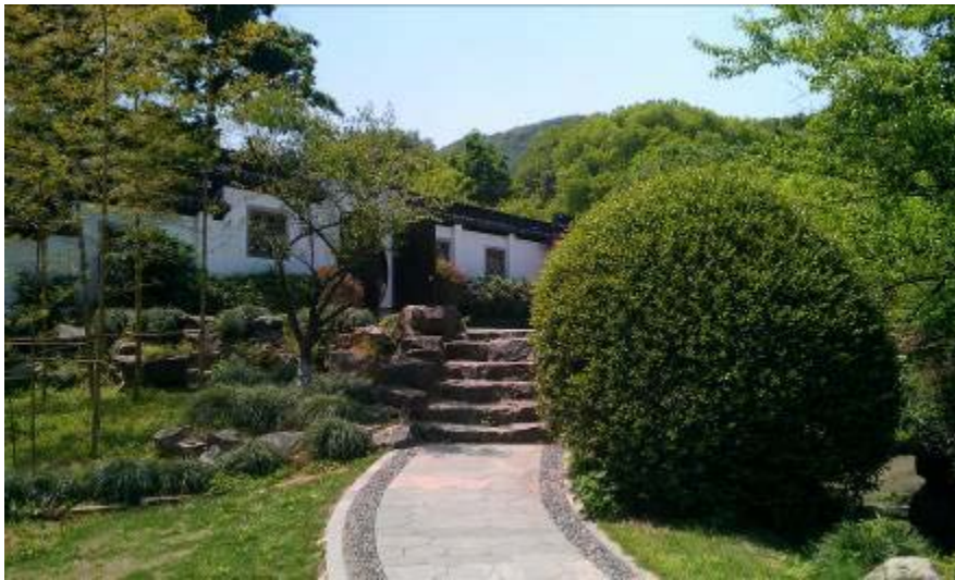
圖 4：靈峰梅園內品梅苑

梅花眾星點點到繁花滿樹，每一時期都有不同韻味，另木蘭山茶園位於植物園東南側鳳凰山小丘上，佔地約 4.6 公頃，園內 50 餘種山茶花品種，也不落餘后，各色山茶花爭奇鬥豔，為靄靄白雪的冬季抹上一道亮麗的風景，在冬季的植物園內，不但沒有冬天的死寂，梅花的繁星滿樹及山茶花的絢麗，為春天的百花齊放拉開了序幕。