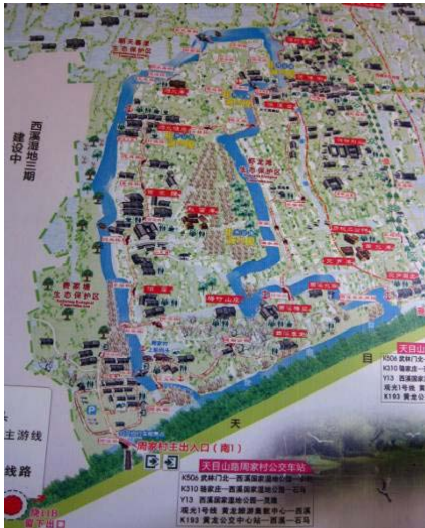
圖 32：西溪國家濕地公園全區平面圖