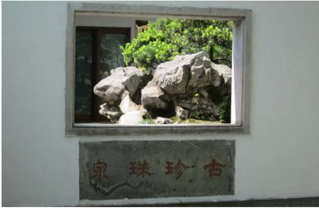
圖 13：玉泉魚躍之古真珠泉