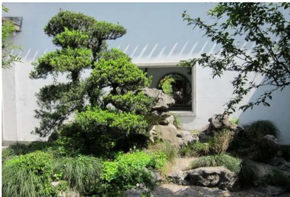
圖 16：玉泉魚躍庭園特色景觀