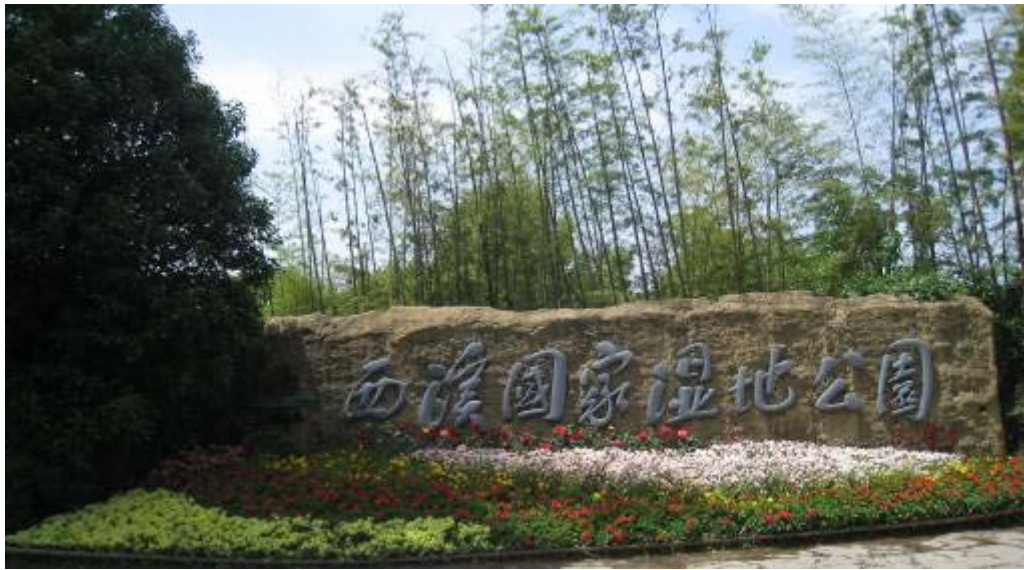
圖 31：西溪國家濕地公園入口名牌