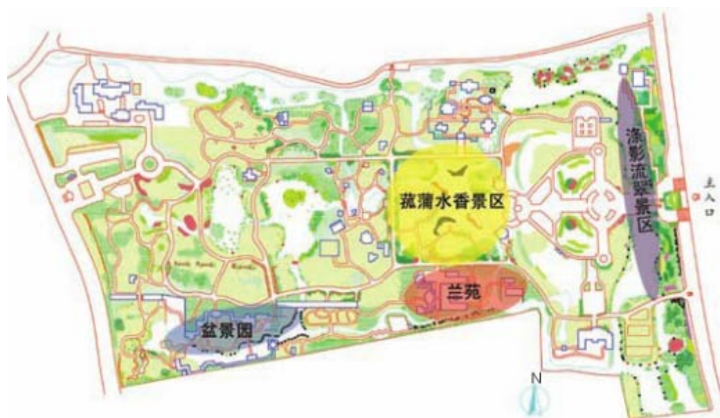
圖 48：杭州花圃平面圖

杭州花圃位於西湖西側，東臨西山路(又稱楊公堤)，西接龍井路，地理位置優越，屬杭州著名的遊覽勝地，公園佔地面積約 28 公頃，其中水域面積約 5.5 公頃，綠地面積約 12 公頃，始建於 1956 年，當時全中國惟一專業性花圃，作為杭州市園林局花卉研究的場域，具有花卉生產、科學研究及觀賞三種功能，並作為補充及豐富杭州植物園花卉植物的觀賞需求，2002 年底隨著西湖西進工程的推動，進行杭州花圃的第二次改造計畫，水域面積藉此得予拓展，新增各種形式的拱橋、平橋及曲橋，連接步道及水系串連，改善園內步道過於僵直的樣態，充分運用地形、植物、水域、建築及設施等元素，創造出一座生態公園。