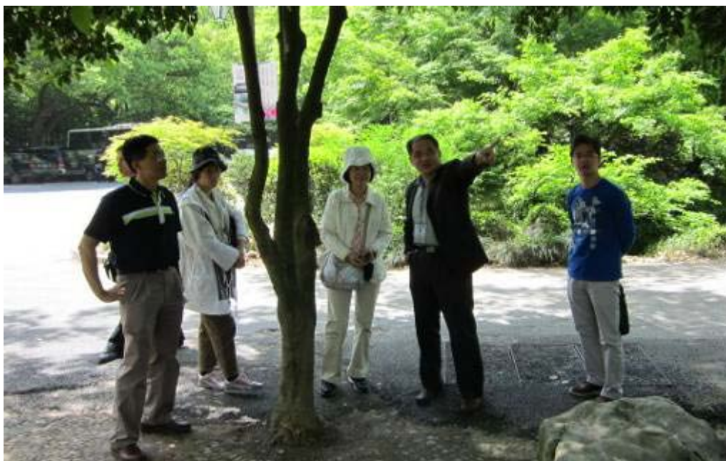
圖 8：杭州植物園區科技研究中心人員解說