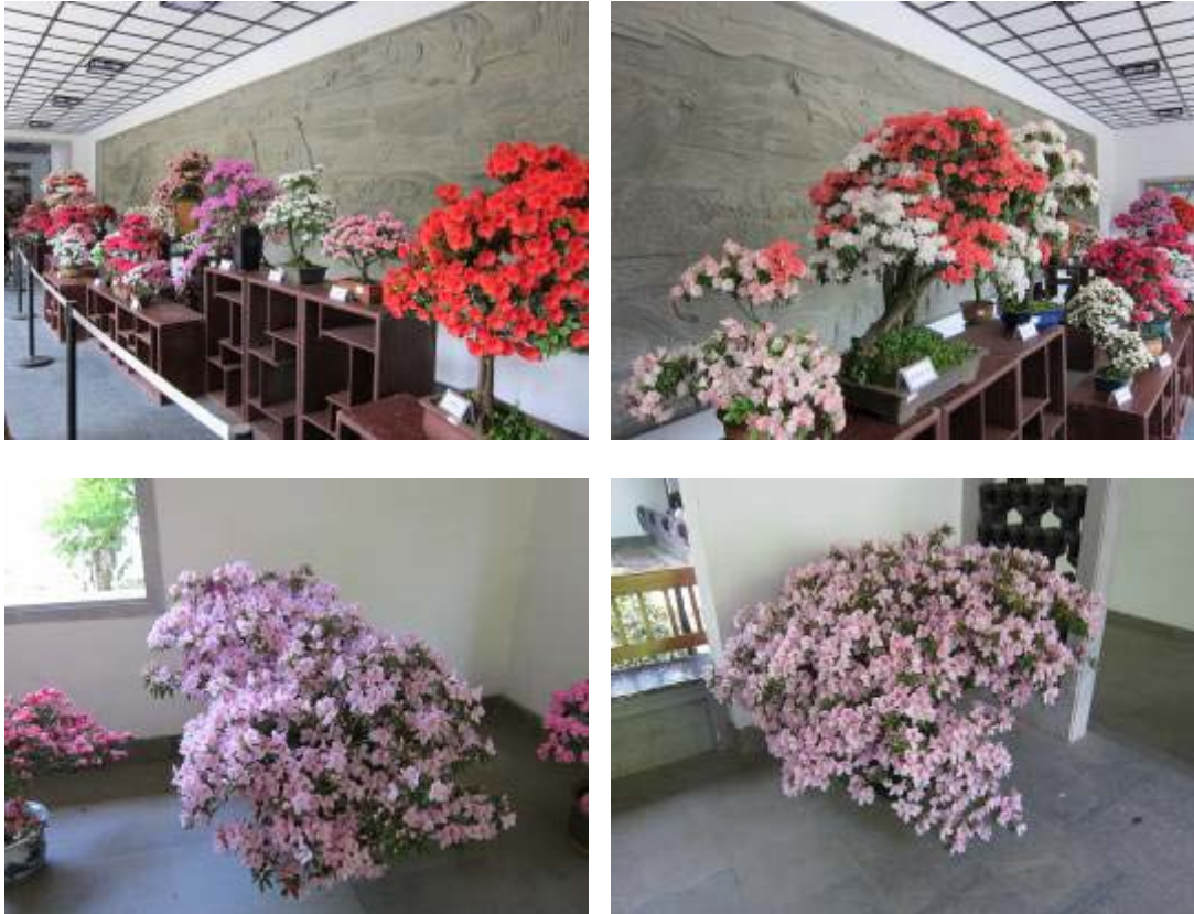
圖 10：玉泉魚躍杜鵑花盆展示