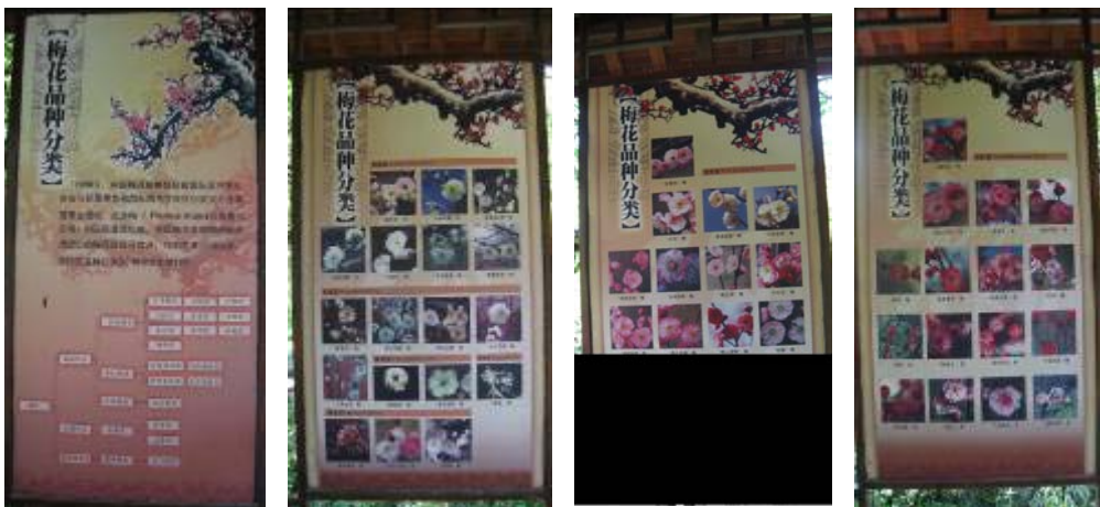
圖 22：梅花品種分類展圖