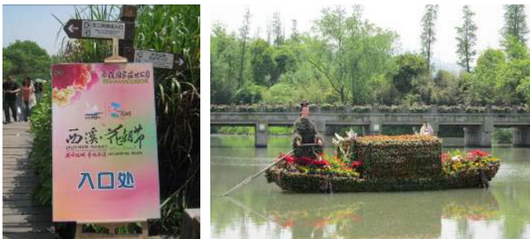
圖 38：西溪花朝節-綠堤景點

溪花朝節則約每年 4~5 月，西溪濕地公園仿照南宋習俗，於西溪綠堤上舉辦花朝節，提供遊客在踏春時節，欣賞百花盛開的春景；端午龍舟盛會則每年端午節前後，於西溪深潭口舉辦，為西溪蔣村歷史最悠久的風俗節慶，最遠可回溯至唐代，延續至南宋已相當鼎盛，到了清代龍舟的激戰，讓下江南的乾隆皇龍新大悅，御筆親提「龍舟盛會」，讓西溪蔣村的龍舟會更加響亮；西溪火柿節約每年 9~12 月，柿子是西溪濕地出名的果物，每到了盛產時節，火紅的柿子已悄悄的高掛樹上，成為西溪最為豐碩甜美的景觀；西溪聽蘆節約每年 11~12 月，撲天盖地的蘆花在陽光中翻騰出點點的金光，將水岸渲染成淡金色的蒼茫，令人目眩神迷，其中秋雪庵則最著名的賞蘆勝地，此地彈指樓則為觀蘆及聽蘆的最佳去處；另外全年皆有的西溪魚夫之旅，提供遊客水上乘舟遊賞濕地每景，以及體驗漁夫撒網捕魚的樂趣。