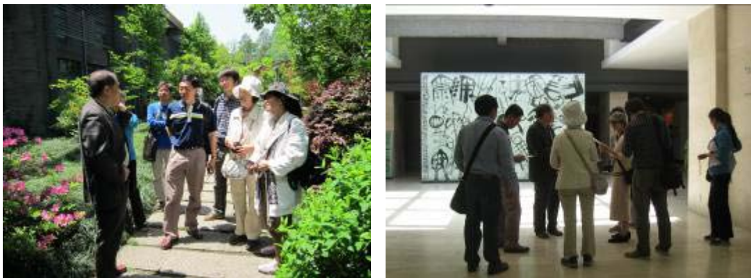
圖 25：植物園區研究人員於韓美林藝術館導覽

本次參訪經由植物園區研究人員引導，首先介紹韓美林藝術館設立的起源，以及戶外雕塑品的瀏覽，其雕塑品主要分為佛像及母與子系列兩大類型，據韓美林先生表示在雕塑佛像時可使人心情平靜，另於母與子系列中，韓美林先生並不在意人體的量體給予的美感，而更是注重人體在不同的動態中所呈現出來的曲線美，總是把人體拉長變細，使女人體態中固有的柔美曲線凸顯出來，並將母愛情感於雕塑品中發揮得淋漓盡致。