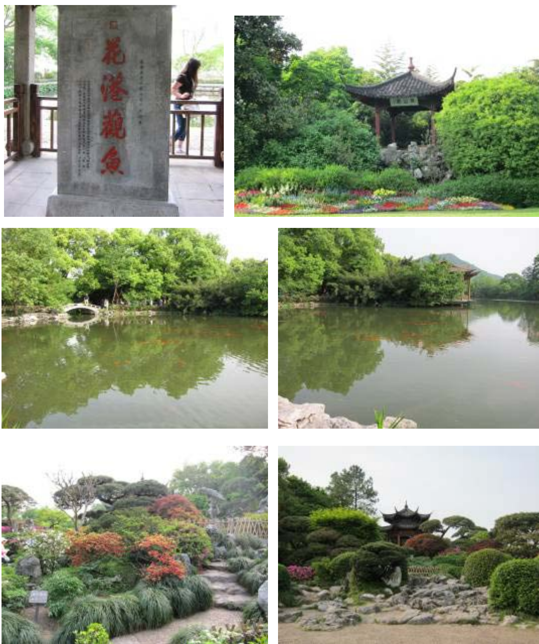
圖 47：花港觀魚園內景色

自然式佈局，全園分別為紅魚池、牡丹園、花港、草坪和叢林五大景區，其中紅魚池為全園賞魚的主景，池中放養數千隻紅錦鯉，另外園內最佳賞花景點就屬牡丹園，庭園造景頗具匠心，園中最高點建有牡丹亭，繞亭種植各種不同的牡丹，盡顯花中之王風範，已成為杭州市民休閒賞花的主要去處之一。